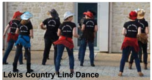
Lévis Country Line Dance