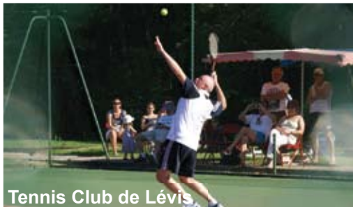
Tennis Club de Lévis