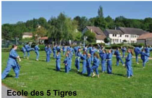
Ecole des 5 Tigres