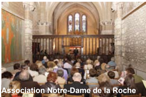
Association Notre-Dame de la Roche