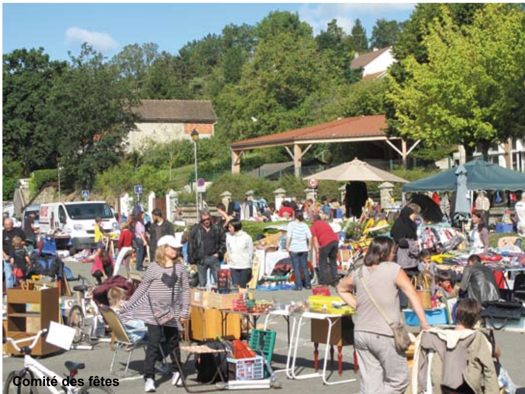
Comité des fêtes