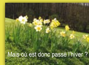
Mais où est donc passé l'hiver ?