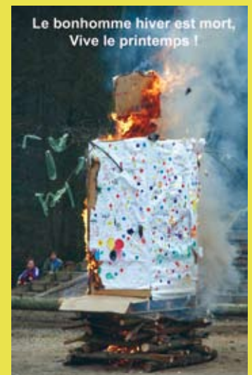
Carnaval du printemps, La Récré, samedi 29 mars