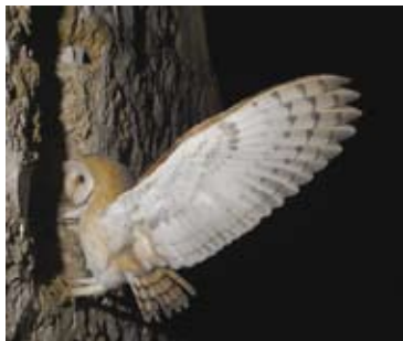
Photos des crapauds et de la chouette chevêche