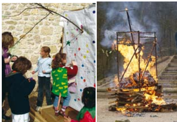
La préparation du «bonhomme hiver» et son destin