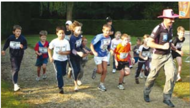
Les « rondes de Lévis », 2ème édition

Arrêté de circulation du 31 août 2009. Remplacement des branchements d'eau en plomb. Le stationnement sera interdit du 1er septembre au 2 novembre 2009, pendant toutes la durée des travaux qui seront réalisés par COCA. IDF, sur les rues de Mauregard et de la Gripière, les routes des Charmes, de Maison Blanche, les impasses du Bel Air et de la Plaine. Des déviations faciliteront la circulation des véhicules. Des panneaux de signalisation seront mis en place par COCA. IDF.