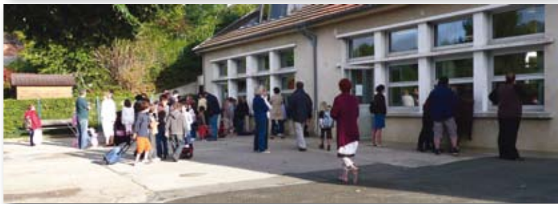
Jour de rentrée à l'Ecole des Sources