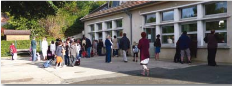
Jour de rentrée à l'Ecole des Sources