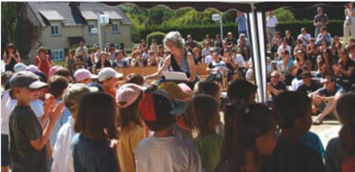
La fête de l'école samedi 27 juin