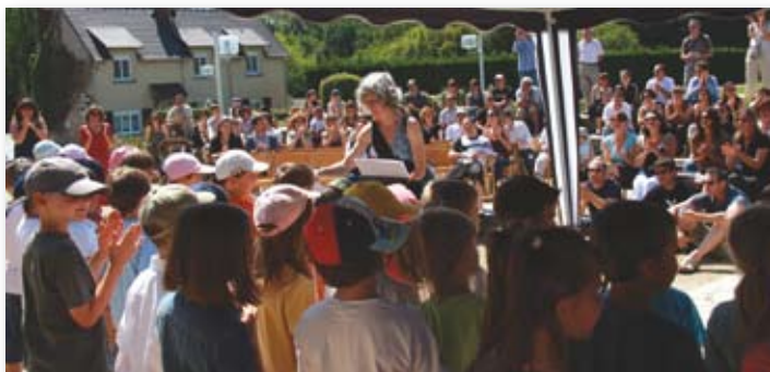
La fête de l'école samedi 27 juin