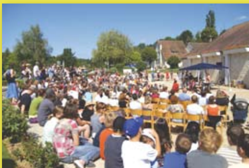
La fête de l'école samedi 27 juin