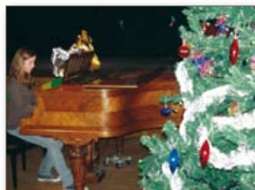
F2L Spectacle de Noël 2008 piano