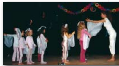
F2L Spectacle de Noël 2008 danse